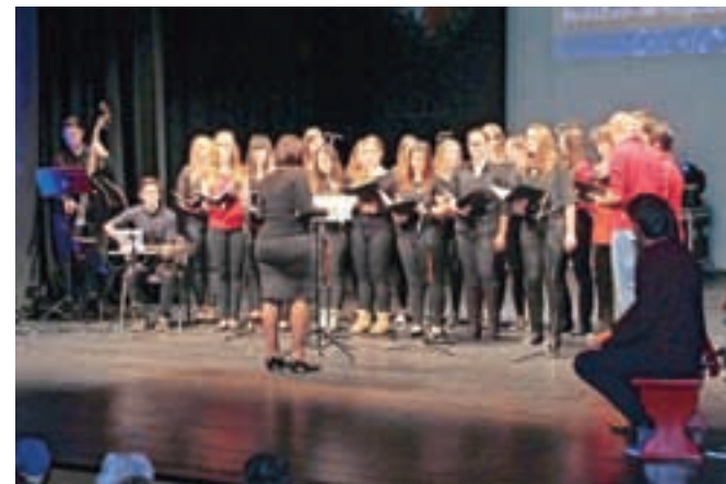
... v dvorani gledališča pa koncert dijakov.