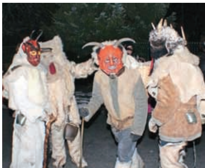
Prihod parkeljnov na Plac pred kulturnim domom na Hrušici

bra premazali s sajami. V dvorani Kulturnega doma so v družbi domače gledališke skupine z otroki tudi pričakali prihod Miklavža. Tradicionalno Miklavževanje organizira domače kulturno športno društvo, od koder so sporočili, da so se tudi letos v času prihoda parkeljnov in v nočnih urah znova soočili s skupino, ki naj bi prihajala z Jesenic in že vrsto let povzroča težave na Hrušici, tako s pirotehniko kot vandalizmom. Hrušičanski parkeljni tako sporočajo, da niso bili krivi za dejanja vandalizma, temveč svoje obujanje tradicije jemljejo skrajno resno.