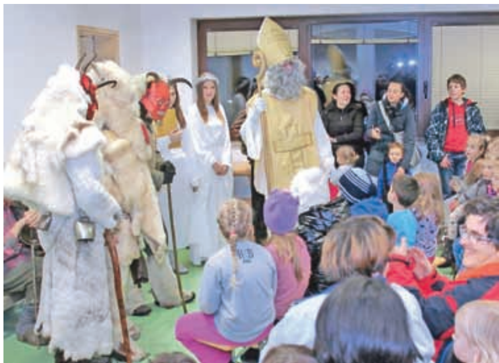
Miklavž je pozdravil otroke in njihove starše tudi na Hrušici.

Miklavž in parkeljni, ki so sprejeli pridne in malo manj pridne otroke, pa so obiskali tudi Hrušico. Na Placu se je zbralo kar okoli 200 obiskovalcev. Te so najprej sprejeli parkeljni, ki so tiste, ki se v minulem letu niso najbolj izkazali s pridnostjo, dodo-