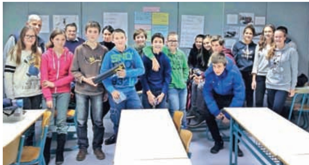
Jeseniški osnovnošolci, ki so tekmovali v igri križemkrazem na Ljudski univerzi Jesenice.