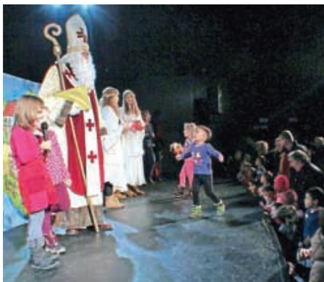
Več kot 500 mladih obiskovalcev je sprejelo Miklavža v dvorani Kina železar.