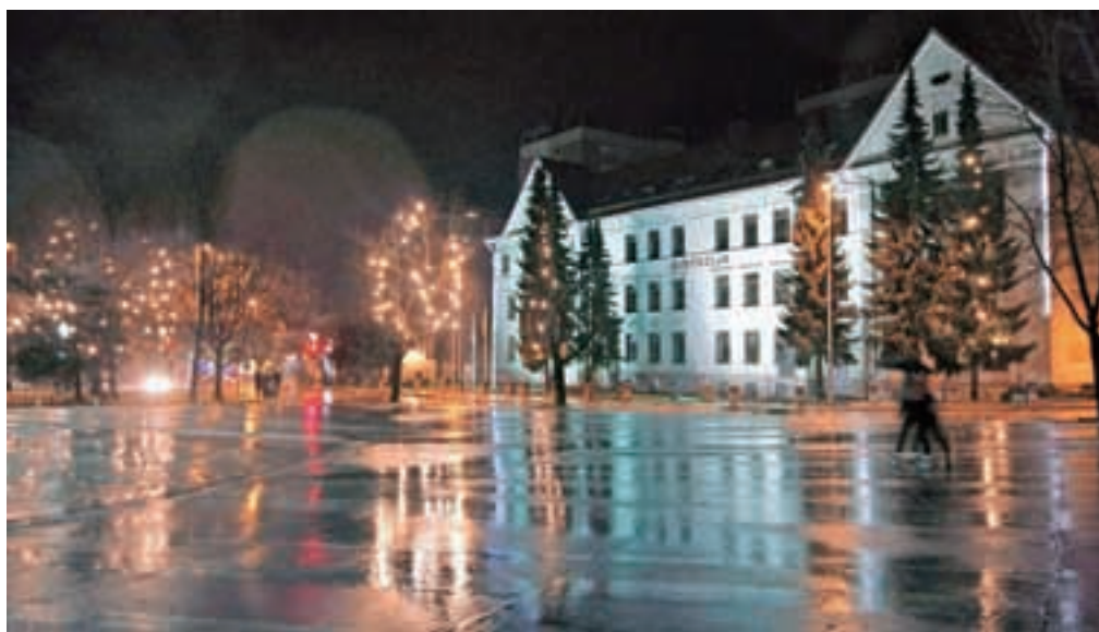
Praznična okrasitev Jesenic

Že danes, v petek, se na Jesenicah začne sklop prazničnih dogodkov v organizaciji Občine Jesenice, ki sodijo pod okrilje akcije Zabavaj se v mestu. Od danes do nedelje bo tako na Čufarjevem trgu med 15. in 19. uro potekal božično-novoletni sejem. Ob 17. uri bo vsak dan za obiskovalce organiziran glasbeni nastop, ob 17.45 pa Božična pravljica in prihod Božička. Glasbenemu nastopu skupine Joške v n bodo obiskovalci lahko prisluhnili danes, v petek, ob 21. uri v Cafe TeaTer baru. Jutri, v soboto, 20. decembra, pa bo ob 21. uri na prireditvenem prostoru na Stari Savi koncert skupine The stroj. Naslednji petek, 26. decembra, bo ob 22. uri na Čufarjevem trgu zabava s skupino Mambo Kings. Vrhunec decembrskih prireditev pa bo v sredo, 31. decembra, ko Občina Jesenice vabi v Športno dvorano Podmežakla na skupno silvestrovanje. Potem ko je prejšnja leta silvestrovanje potekalo na prostem na Čufarjevem trgu in lani v no-